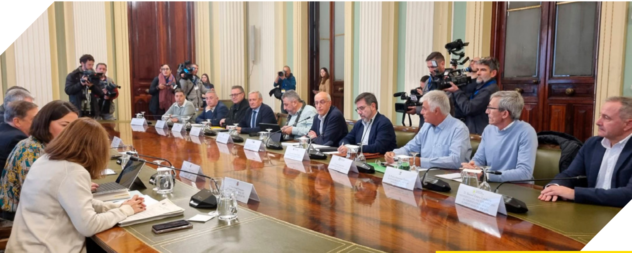
Reunión de coordinación en el Ministerio de Agricultura, Pesca y Alimentación.

La PPA pone a prueba al sector porcino, pero también demuestra la importancia de la prevención, la bioseguridad y la colaboración entre administraciones, ganaderos y cooperativas agroalimentarias.