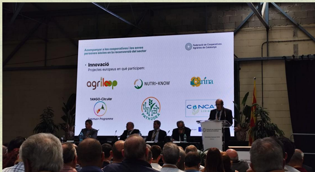
En Asamblea General