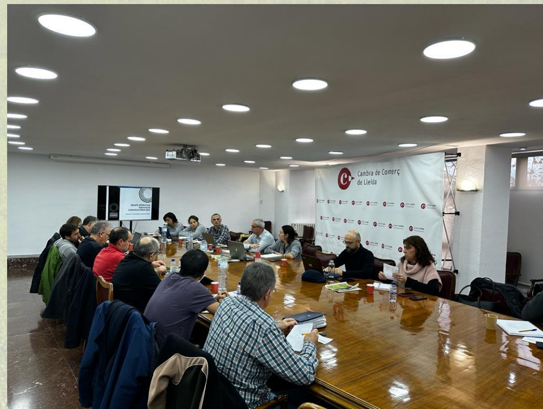
Reunión Grupo de cooperativas de Cereales y herbáceos

WEB FCAC: https://www.cooperativesagraries.cat/ca/innovacio/l/11588-carina.html