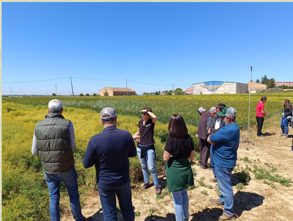
Jornada en Agroperera