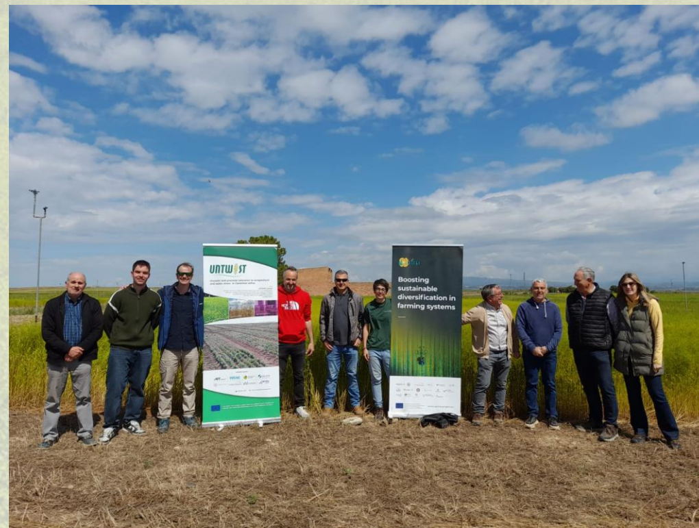
Jornada en Panelles