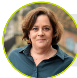
HENAR MORENO MARTÍNEZ

Candidato de VOX a las elecciones al Parlamento Europeo