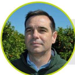
PEDRO GALLARDO BARRENA

Portavoz de Agricultura del Partido Popular en el Congreso de los Diputados