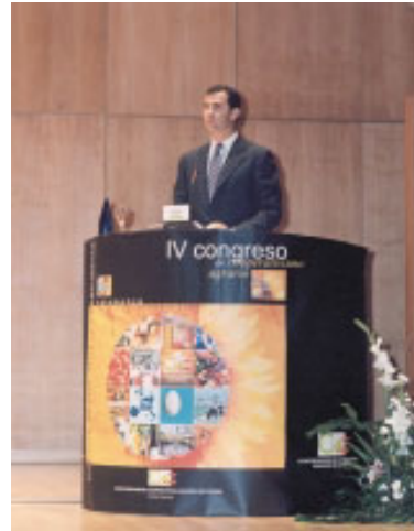
D. Felipe animó a los cooperativistas a continuar con su trabajo, a pesar de reconocer el panorama complejo que se vive en la actualidad