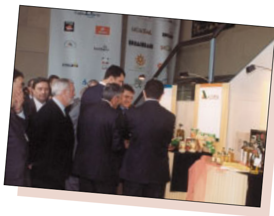
El Príncipe Felipe en el stand de Acorex.