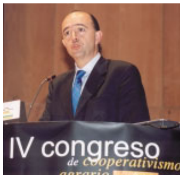
Manuel Lamela, Subsecretario del Ministerio de Agricultura.