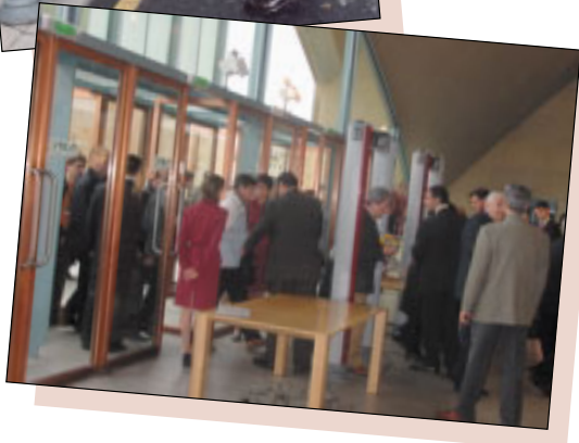
Más de mil quinientas personas acudieron al IV Congreso en Salamanca.