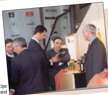
El Príncipe junto al stand de Hojiblanca.