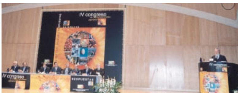
Miguel Arias Cañete, Ministro de Agricultura en el acto de inauguración.