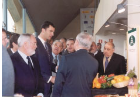
El Príncipe Felipe y el ministro Miguel Arias Cañete junto al stand de Anecoop.