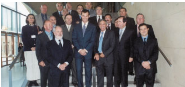
El Príncipe Felipe, Juan Vicente Herrera, Presidente de la Junta de Castilla y León y Miguel Arias Cañete, ministro de Agricultura, junto con los miembros del Consejo Rector de CCAE.