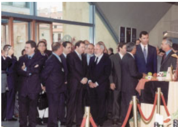
Príncipe Felipe en el stand de AN.