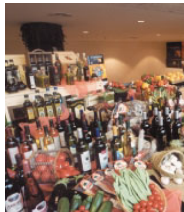
Bodegón de productos cooperativos.