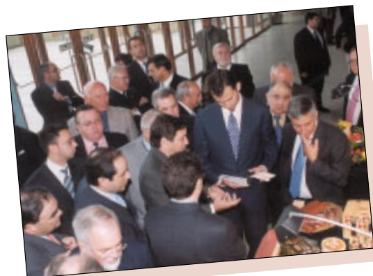
El Príncipe Felipe junto al stand de Covap.