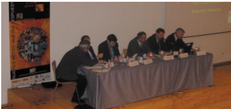
Grupo III Prestación de servicios.