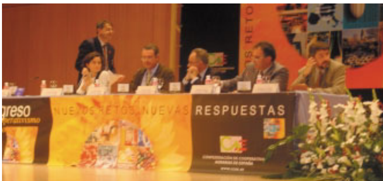
Grupo II Dimensión Empresarial ante el mercado globalizado.