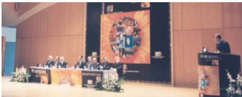
Juan Vicente Herrera, presidente de la Comunidad de Castilla y León, durante su intervención.

En el acto de inauguración participó a través de un video saludo el Comisario de Agricultura de la Unión Europea, Franz Fischler, que defendió la propuesta de la revisión intermedia de la PAC, e insistió en la necesidad de llevar a cabo un desacoplamiento de las ayu-