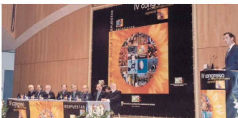
Durante su intervención, el príncipe Felipe destacó el papel dinamizador de las cooperativas en la incorporación de jóvenes a las explotaciones agrarias como una opción de futuro.