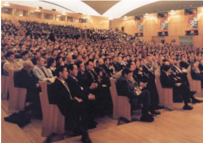
Vista general de los asistentes en la sala mayor durante la inauguración.