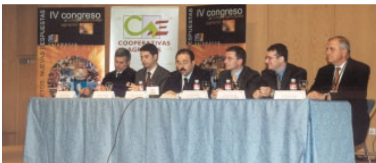
Grupo de Trabajo I Cooperativas Agrarias y Calidad.