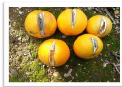
Rajado de cítricos

Las indemnizaciones alcanzaron los 13 millones de € .