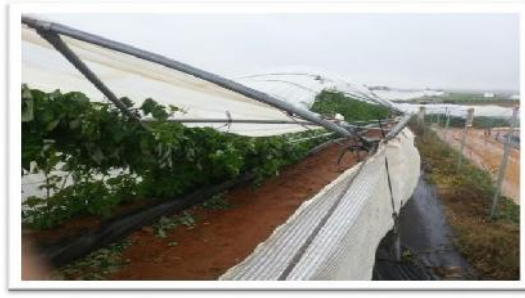
Daños en producción e instalaciones (macrotúneles)

Es un seguro de alta implantación, particularmente en las estructuras de invernadero, aseguradas al 90%. La contratación abarca 7.134 ha, con un valor de producción superior a los 185 millones de euros. Las coberturas están muy adaptadas a las necesidades del sector y comprenden: