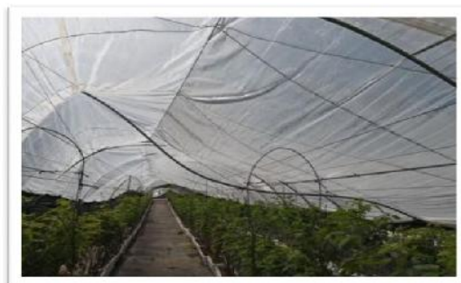
Daños en invernaderos