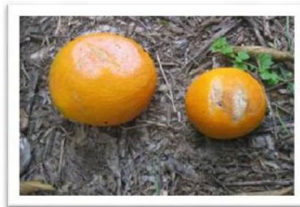
Rameado por viento

Se recibieron reclamaciones de viento de más de 18.000 ha, de las que 11.335 correspondieron a los cítricos, donde los daños no fueron muy altos (afección de un 20%).